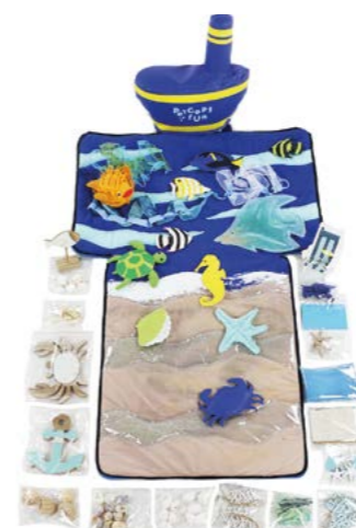
PLÁŽ , didaktický set