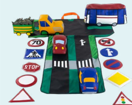
DOPRAVA , didaktický set

Pohyb, vnímání a komunikace se navzájem ovlivňují se správně zvolenými pomůckami oslovíme všechny tři oblasti současně.