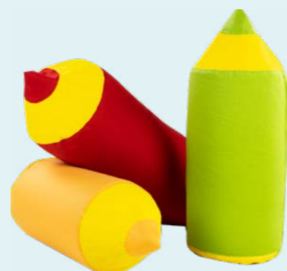
PASTELKA , polohovací pomůcka

Snahou vývojářů je zajistit špičkovou funkčnost výrobků, které mohou zkvalitnit život lidí s různými formami specifických potřeb.