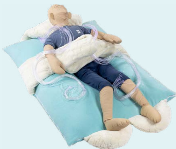
KANAPFÁSEK , polohovací vak