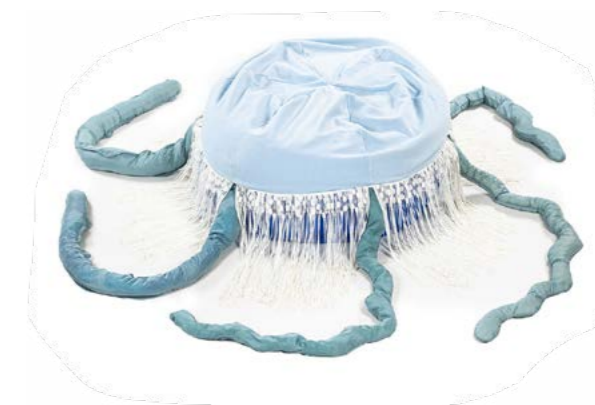
MEDÚZA , haptický polohovací vak

Veškeré zdejší pomůcky a mnoho dalších naleznete u nás na webu percept-fun.com .