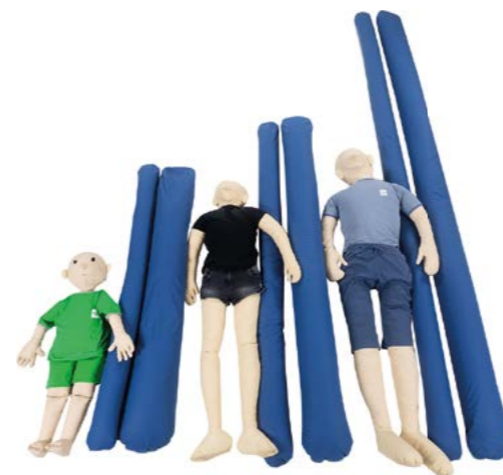
HAD , polohovací pomůcka